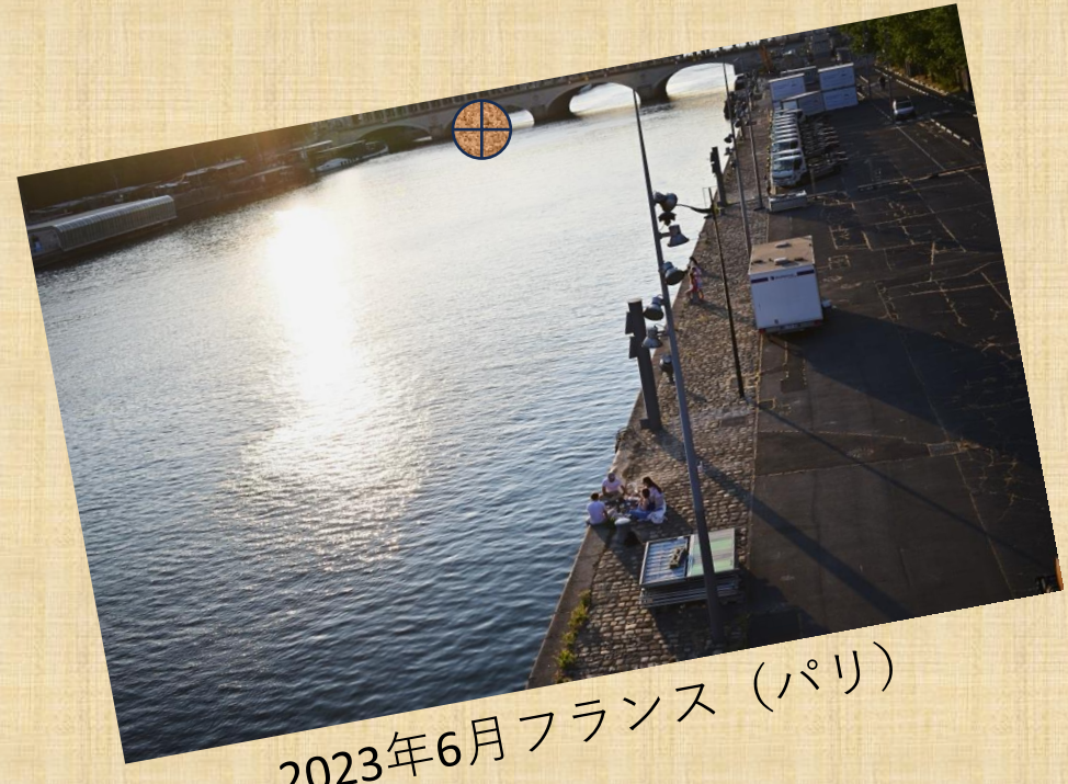
2023年6月フランス (パリ)