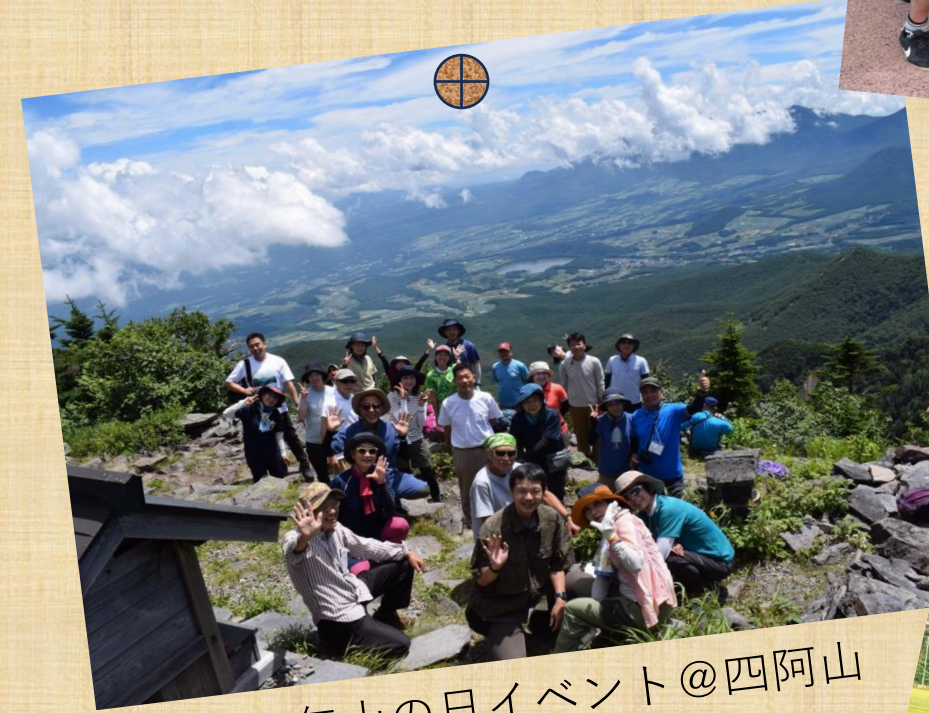
2022年山の日イベント@四阿山