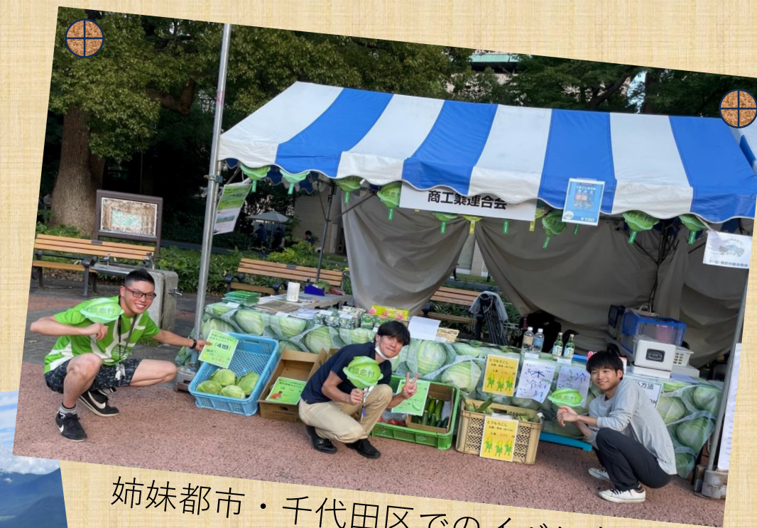
姉妹都市・千代田区でのイベント