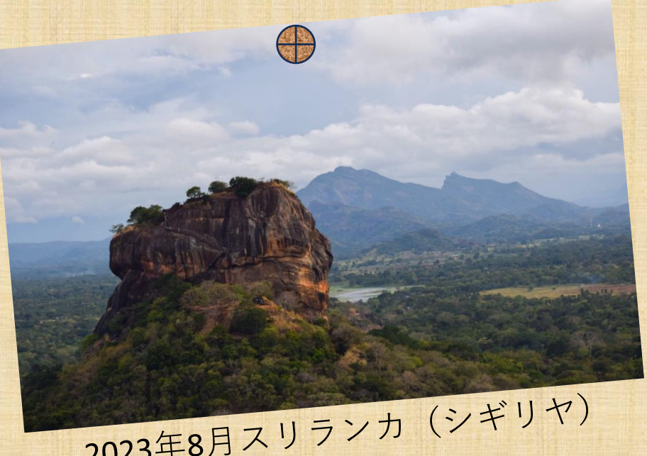
2023年8月スリランカ (シギリヤ)