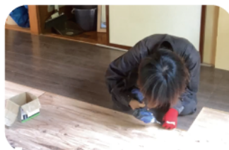
フローリング材設置