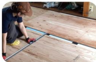
床下地設置の様子