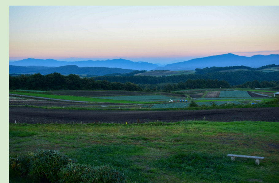
日没のキャベツ畑

『雄大な自然の景色』と空気が澄んでいるからこそ生み出される『色のコントラスト』が魅力