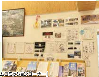
「観光案内所にあるフィルムコミッションコーナー」

観光案内所には撮影風景などを掲載したフィルムコミッションコーナーがあります。中には某有名人のサインも。ご興味のある方はぜひ足を運んでいただきたいです。