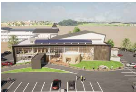
サーラ婦恋完成予想図

同時に婦恋高校と東部小学校の体育館や総合グラウンドとの連携を図りながら、子どもから高齢者までの健康増進にも寄与する施設となります。また災害時の避難施設ともなります。