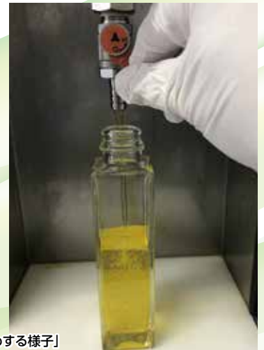
「搾油したえごまを瓶詰めする様子」

あさまのいぶきでの活動としては野菜の生産が減り始めるなか11月からえごまの受付を開始しており、えごまの選別、搾油を店内での接客をしつつ作業場にておこなっております。えごまの選別、搾油作業も2年目となりだいぶえごま油の知識もついてきました。より多くの方にえごまを知って頂くために実際にえごま、えごま油を使った料理が提供出来るようなイベントを村内で出来ればとも考えております。