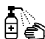
手指消毒用アルコールによる消毒の励行