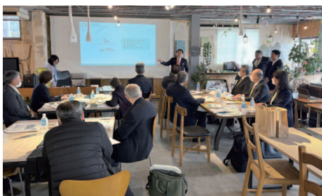
area 898 にて研修