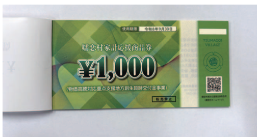
嬭恋村家計応援商品券