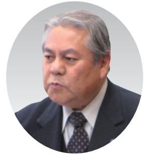
大久保 守 議員