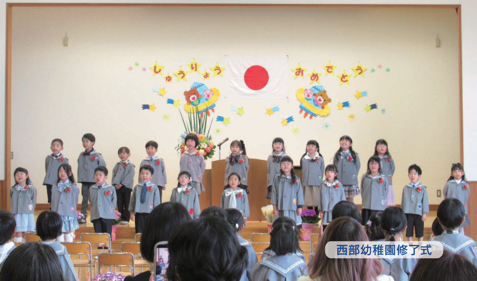
西部幼稚園修了式