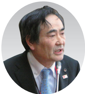
大野 克美 議員

村長 ふるさと納税の拡充を最優先とし、返礼品や情報発信を強化する。あわせて企業版ふるさと納税も活用し、基金の積み立てにつなげていく