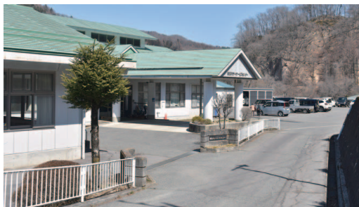
嬭恋村デイサービスセンター

地方自治法第244条の2第6項に基づき、「社会福祉法人 嬭恋村社会福祉協議会」を指定管理者として指定することに決まりました。 指定期間は、令和8年4月1日から令和13年3月31日までの5年間になります。