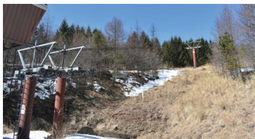
撤去が予定されるワイヤーロープ