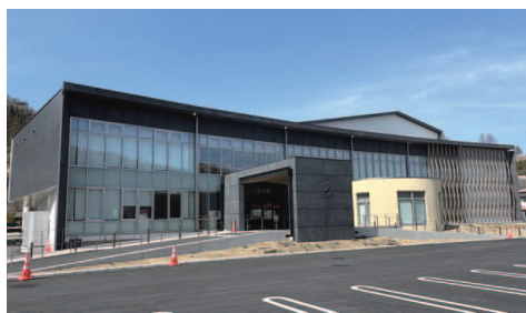
供用開始から半年が経過するサーラ嬭恋

料で205万4千円と嬭恋高校生徒学バス運行委託料で432万円を計上しているが、それぞれの利用者は。