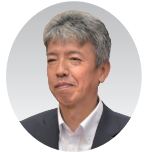
黒岩 敏行 議員