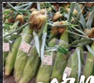
白いとうもろこしや 白と黄色のミックス品種に 出会うかも…!