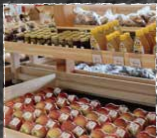
お土産が大体揃います◎

キャベツ、とうもろこし、トマト、 花豆、鎌原きゅうり、果物、雑貨、 地元の多品目野菜、加工食品等