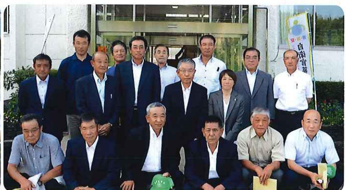
農業委員の皆さん