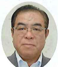
地区 芦生田 下谷 忠 1期目