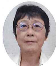
担当地区 干俣 千川 初枝 1期目