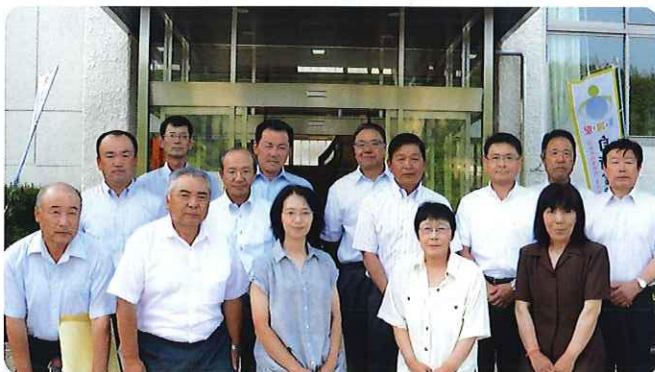
農地利用最適化推進委員の皆さん