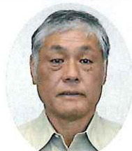
地区 大笹 松本 一行 1期目

これから改正農業委員会法を勉強しながら農業委員、農地利用最適化推進委員共に婦恋村の農業の発展のために委員が一丸となり頑張っていく所存でございます。