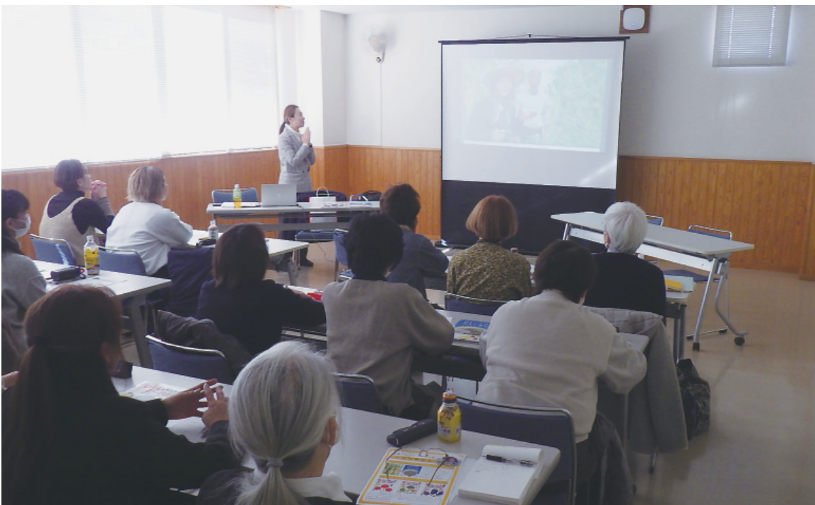
女性講座受講の様子

す。色々と問題はありますが、意欲ある若い農業者やこれから希望を持って就農予定の若い人たちの将来に向け、地域の地権者や耕作者協力の元、行政と一体となって、農地を守る必要を感じます。