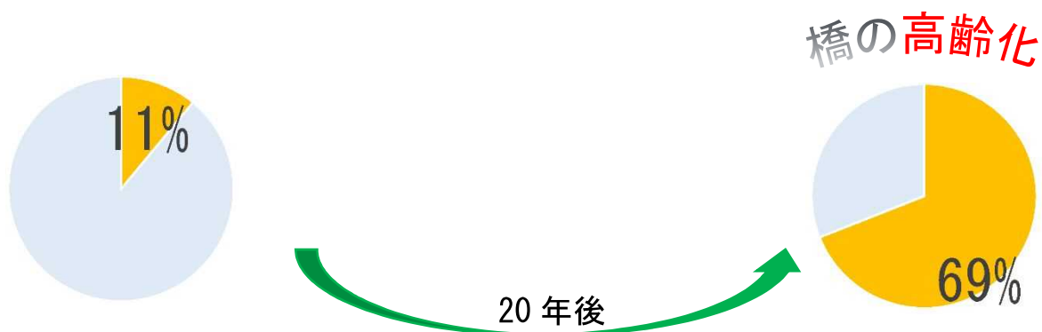
孺恋村が管理する架設後50年を経過する橋梁の割合

そこで、橋の長寿命化修繕計画では、従来の「 悪くなってから補修する管理（事後保全的管理） 」から、「 損傷が小さなうちに計画的に補修を行い、橋の長寿命化を図る管理（予防保全的管理） 」へ移行し、村民の皆様が生活する上で、大切な道路交通の安全性を守っていくことを目的として策定しています。