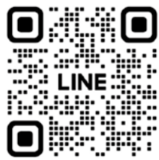
「ネイル・顔タイプ診断® 予約LINE」

ネイルのお問い合わせやご予約は、Instagram「@303nail」またはLINEからお気軽にどうぞ。