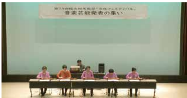
7年振りの参加となる大正琴部