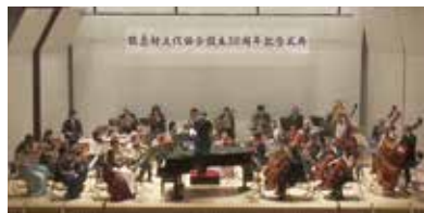
記念コンサートの様子

当日は、村内外からの来賓をはじめ、文化協会会員や村民など約210名が出席し、これまでの歩みを振り返りながら節目の年を祝いました。