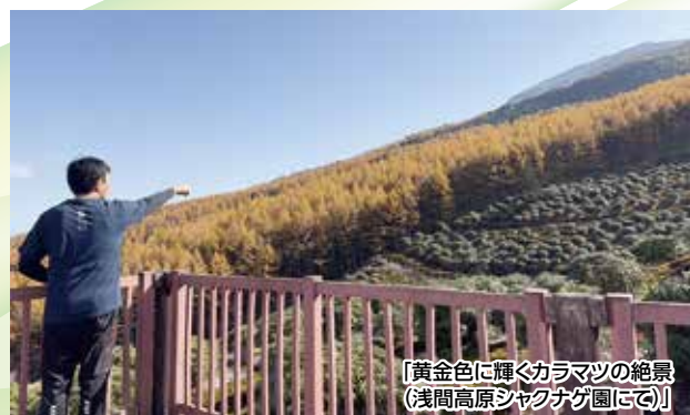
「黄金色に輝くカラマツの絶景 (浅間高原ジャクナグ園にて)」