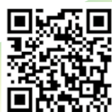
「鎌原ドライブイン (Xアカウント)」