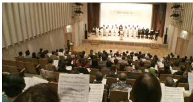
最後は会場の皆で全体合唱