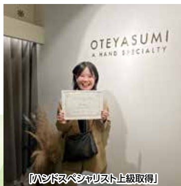
「ハンドスぺシャリスト上級取得」