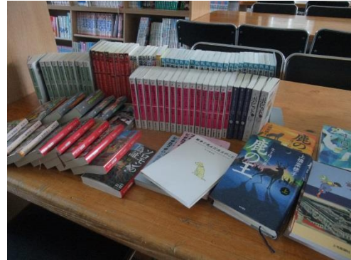
※中学校教育振興助成事業