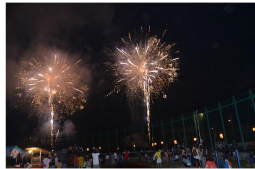
※つまごい祭りのようす